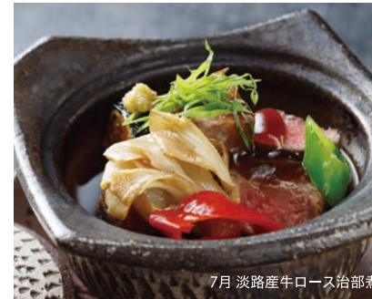
7月 淡路産牛ロース治部煮