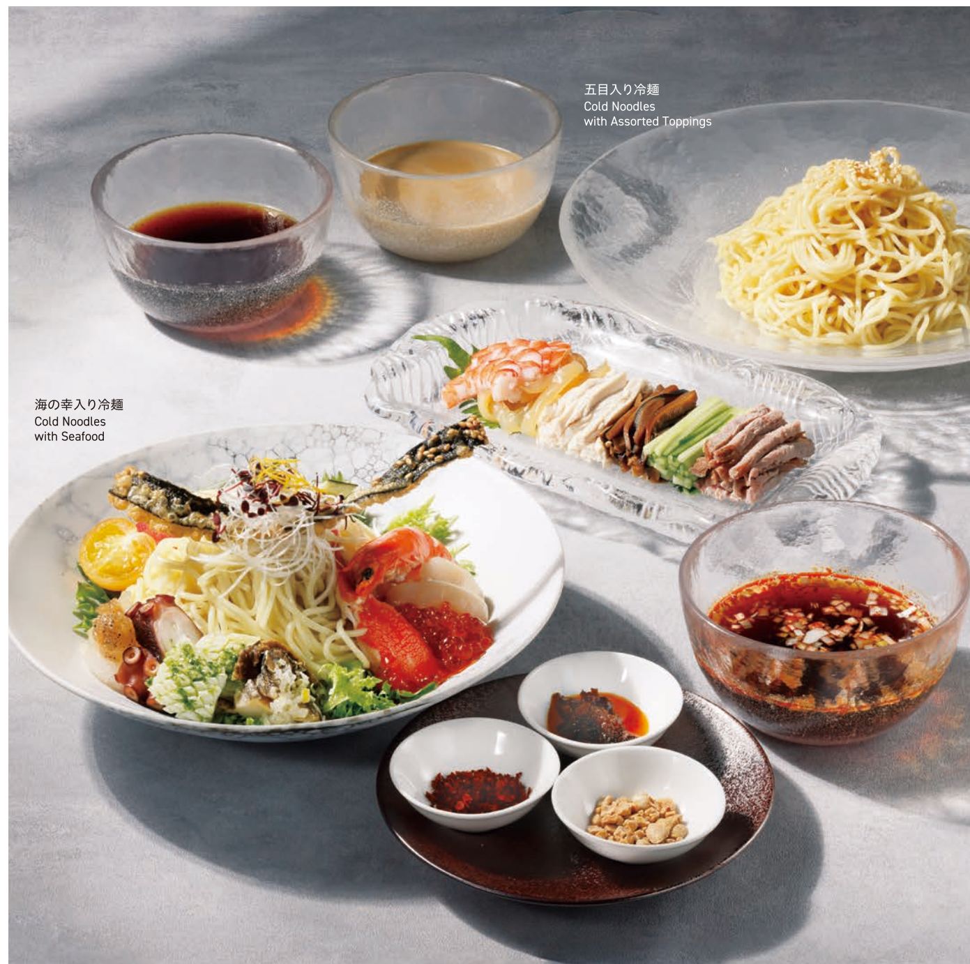
五目入り冷麺 Cold Noodles with Assorted Toppings