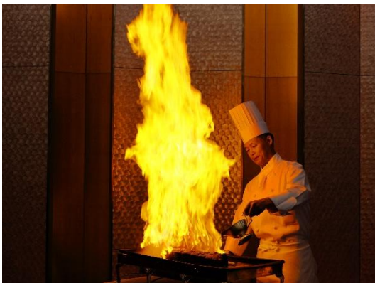
フランベサービス

※One Harmony は、オークラ ニッコー ホテルズでご利用いただける入会金・年会費無料の会員プログラムです。