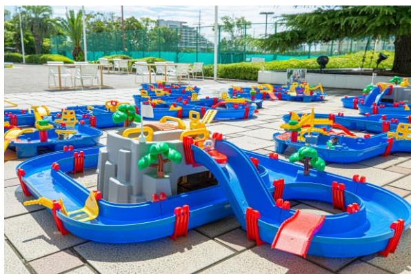
アクアプレイコーナー

みなと神戸を代表する神戸ポートタワーや神戸海洋博物館がご覧いただける開放感あふれる屋外プールを、本年も期間限定でオープンいたします。25m×10mのプールと幼児用のプールを備えており、ランチタイムには隣接するプールサイドレストランで、シェフおすすめの神戸ビーフバーガーをはじめ、ハワイアンプレートやシェフ特製のかき氷などの軽食を召し上がっていただけます。プールのほかにも、さまざまな「遊び」が楽しめるキッズプレイエリア、アクアプレイコーナーを併設しており、夏の優雅なリゾート気分をご家族でお楽しみいただけます。また、平日限定でご滞在中は何度も屋外プールが利用できる宿泊プランや、本年初開催となる、お仲間同士の集いや企業の懇親会などのイベント事にご利用いただける「貸し切りプラン」のご予約も、7月の平日限定で承ります。