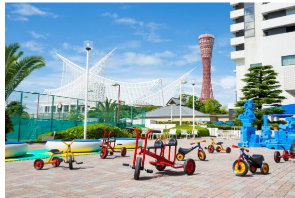
キッズプレイエリア イメージ