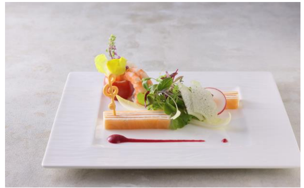
祝宴の為のプレリュード サーモンとカリフラワーのミルフィーユ トマトケースに詰めた小海老 赤蕪のソースとともに