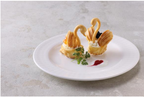
イントロダクション～出会い～マスカルポーネのムースを詰めた二羽の白鳥 キャビアとイクラのアクセントで