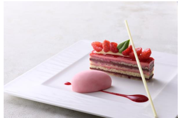
ベリー・ベリー・ベリー 木苺のオペラ 赤い木の実のアイスクリーム添え