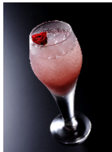
「Moscow Jeanne(モスコ ジャンヌ)」

ご予約・お問い合わせ／「メインバー エメラルド」 TEL.078-333-3524 (直通)