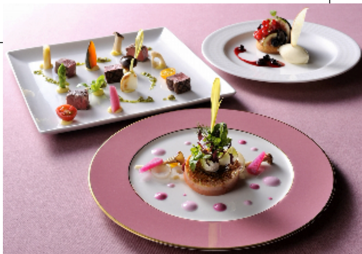
エメラルドランチ (10月31日までのメニュー)